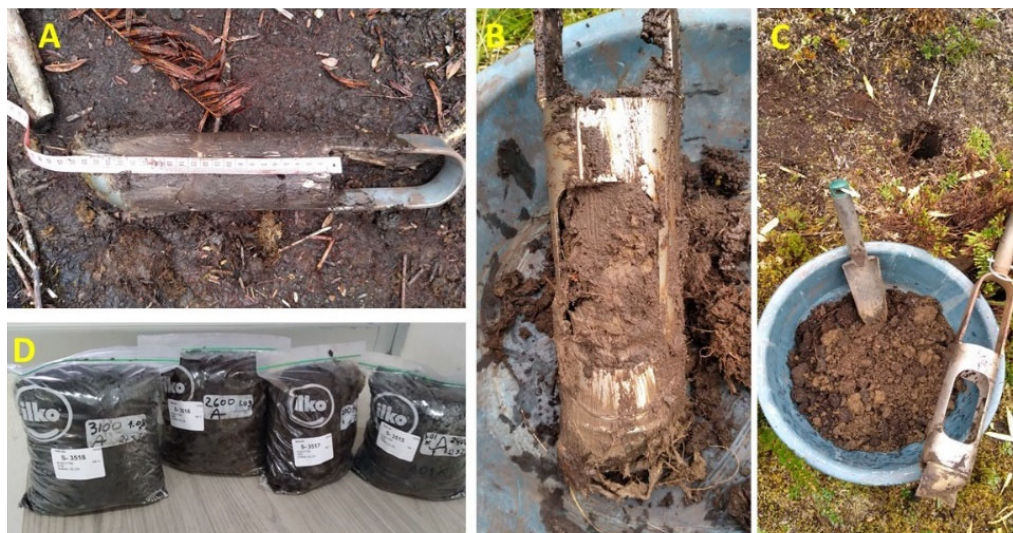
Figura 2. Registro fotográfico de la recolección de muestras compuestas de suelo en turberas de altura, A: Muestra de suelo a 20 cm; B: Uso de barreno; C: Muestra compuesta de varias submuestras; D: Muestras para su análisis. Parque Nacional Tapantí Macizo de la Muerte, Costa Rica (Fotos: P. Gastezzi-Arias).