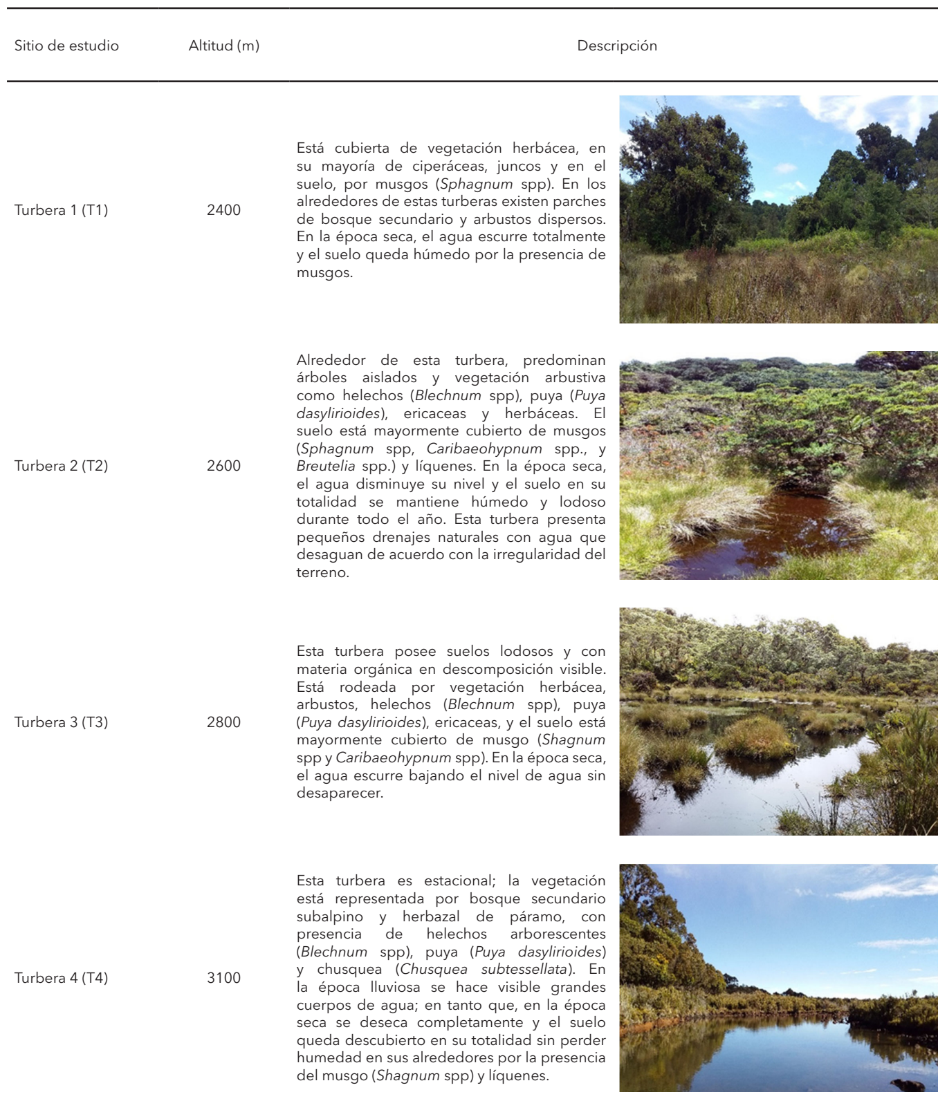
Table 1. Description of soil-related vegetation in the high peatbogs of Tapantí Macizo de la Muerte National Park, Costa Rica.