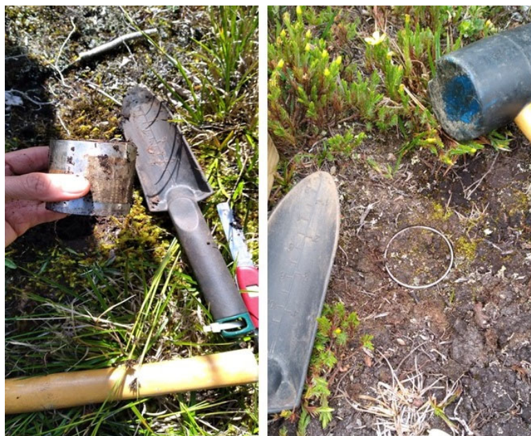
Figura 3. Registro fotográfico de la recolección de muestras de suelo con cilindros en turberas de altura, Parque Nacional Tapantí Macizo de la Muerte, Costa Rica.