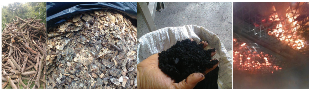
Figura 3. Transformación de la biomasa vegetal a biocarbón a partir de podas del aguacate.

Por otro lado, Lehman 2007 sugiere una remoción del 20% de CO 2 de la atmósfera utilizando el biocarbón como estrategia de mitigación del cambio climático, en otras palabras, cada tonelada de biomasa convertida a biocarbón podría estar removiendo 20% de su contenido de carbono comparado con su ciclo natural