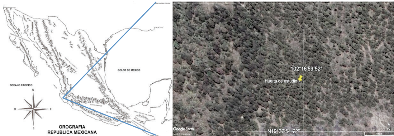
Figura 1. Huerta de aguacate para ensayos de campo.